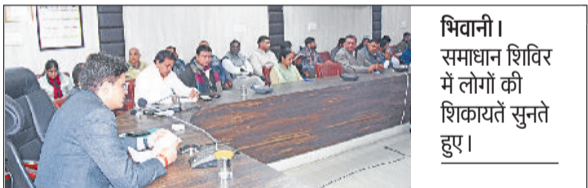
भिवानी। समाधान शिविर में लोगों की शिकायतें सुनते हुए।