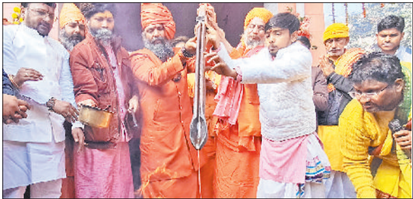
भिवानी। आयोजित हवन में आहुति डालते हुए।