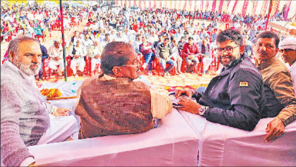
नारनौल। सम्मेलन में मौजूद जजपा नेता व कार्यकर्ता।

जननायक जनता पार्टी की ओर से दौंगड़ा अहीर चौक पर जिला युवा योद्धा सम्मेलन महायुवा योद्धा सम्मेलन बन गया। इसमें आए पार्टी के राष्ट्रीय अध्यक्ष डॉ. अजय सिंह चौटाला ने कहा कि आप लोगों के मेहनत की वजह से पार्टी के स्थापना दिवस पर आयोजित जौद जिले के जुलाना में आयोजित रैली की सफल हुई। चौटाला ने भारतीय